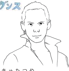
きよたつや Cユタツヤ せんせい

CM 振付やダンス公演で、60億人と 踊りで心をつなげる世界平和を めざしています。