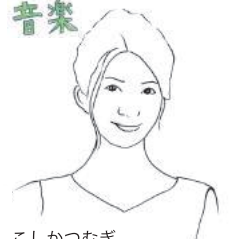
こしかつむぎ 小鹿紡 せんせい